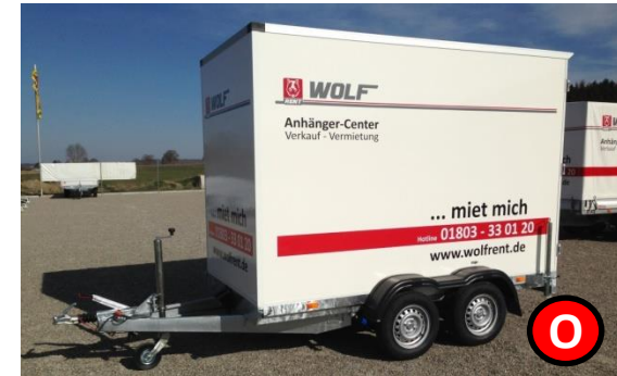
Kofferranhänger 2000 kg