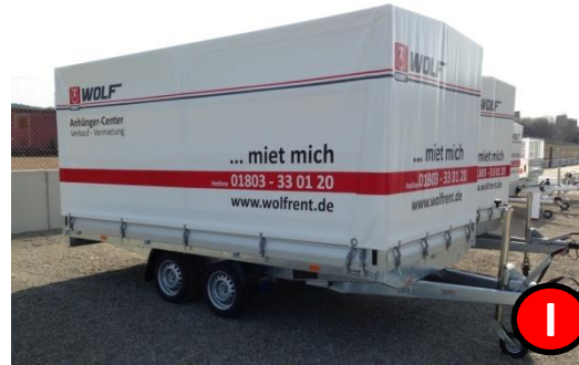
Cargo-Hochlader 2700 kg