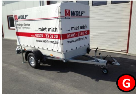
Kastenanhänger 1300 kg