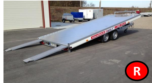
Alu - Autotransporter 2500 kg

Sie bezahlen monatlich für diese 5 Anhänger nur