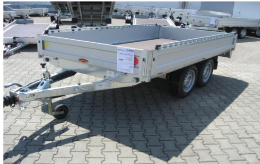
Hochlader oder Überlader