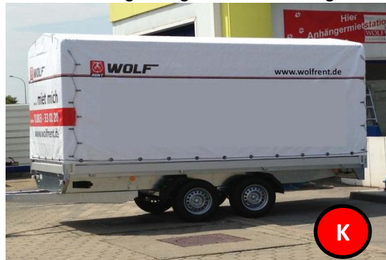
Hochlader Plane-Spiegel, z.GG. 2700 kg