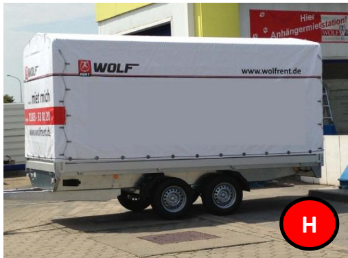
Hochlader Plane-Spiegel z.GG. 2000 kg

PKW - Anhänger mit Plane Spiegel sind ein wichtiger Bestandteil in jeder Anhänger Vermietung. Diese Fahrzeuge haben einen großen Anteil an den Einnahmen. Sie sind die preisgünstige Alternative zu Kleintransportern. Bei vielen Autovermietungen werden diese Fahrzeuge oftmals in Verbindung mit Transportern gerne als Gespann vermietet.