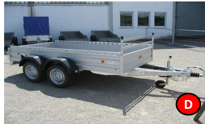
Kastenanhänger 2000 kg , gebremst