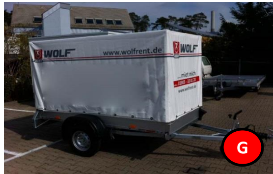
Kastenanhänger ungebremst 1300 kg