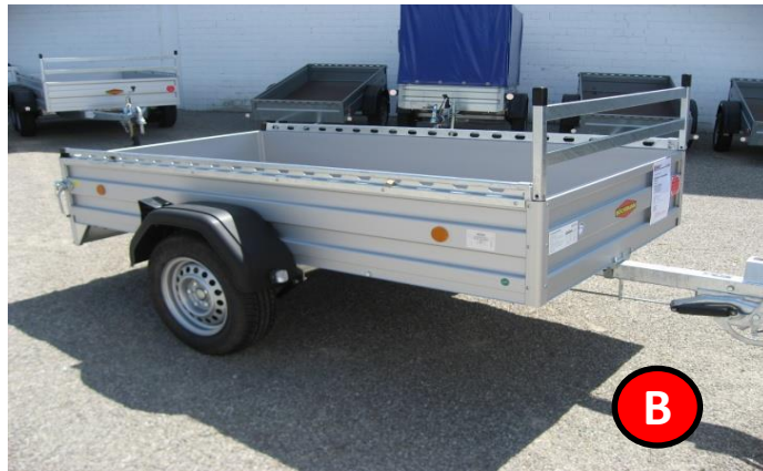
Kastenanhänger 1300 kg , gebremst