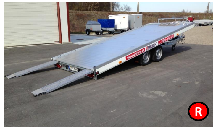
ALU - Autotransporter z. GG. 3000 kg, Nutzlast: 2250 kg Hydraulisch kippbar