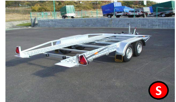
Autotransporter TL z. GG. 2500 kg

In Zeiten des Internets kaufen immer mehr Interessenten Ihre Autos oder andere Fahrzeuge über das Internet. Für einen günstigen Kauf nimmt der Kunde oft große Entfernungen in Kauf. Das Problem ist dann nur noch der Transport. Werkstätten geben Ihre Anhänger aus versicherungstechnischen Gründen nicht mehr ab. Dem Käufer bleibt deshalb nur der Weg zur Anhänger -vermietung. Mit unseren Alu - Autotransporten bieten wir Ihnen, durch die hohen Nutzlasten gegenüber anderen Anbietern, ein konkurrenzloses Produkt