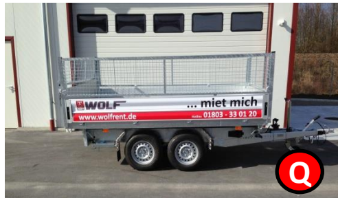
Rückwärtskipper 2500 kg