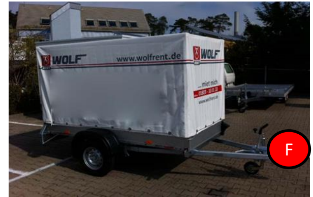
Kastenanhänger ungebremst 750 kg