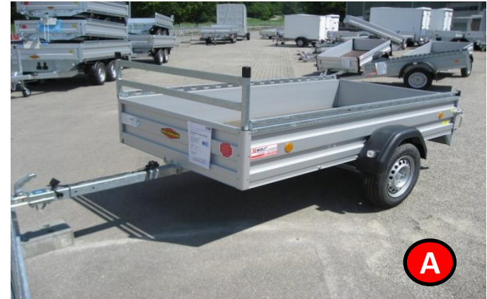
Kastenanhänger 750 kg ungebremst

Der PKW Kastenanhänger zeichnen sich, auf Grund Ihrer Bauart, durch eine niedrige Ladehöhe und ein stabiles Fahrverhalten aus. Die Anhänger gibt es wahlweise mit Bordwänden aus Aluminium eloxiert oder aus Plywood (Siebdruckplatte).