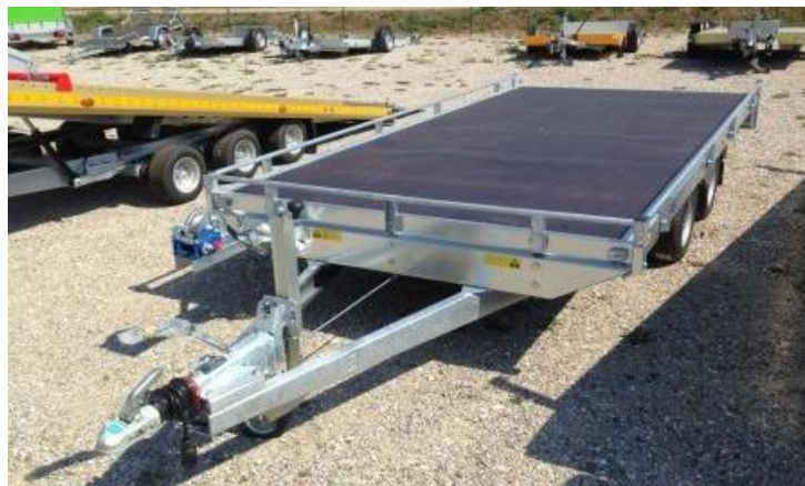
Autotransporter z. GG. 2700 kg, Nutzlast: 2100 kg ohne Kipphydraulik